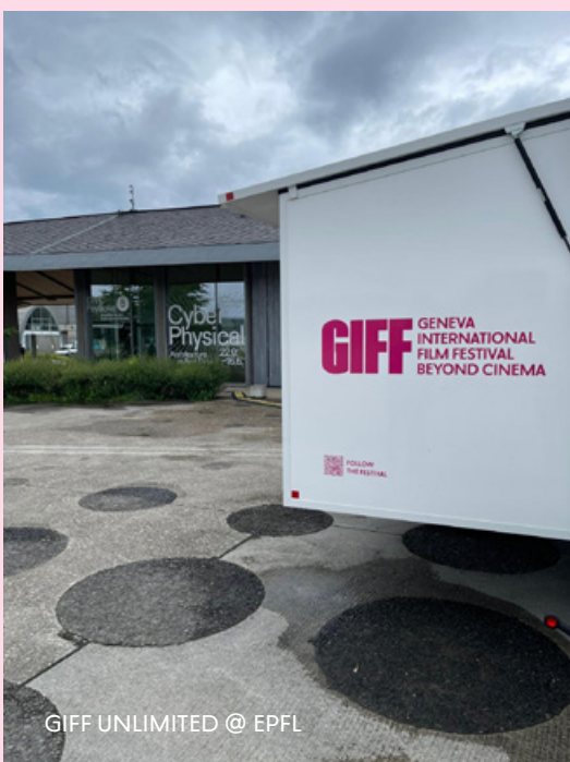
GIFF UNLIMITED @ EPFL

L'introduction et la conclusion sont modérées avec toute la classe.