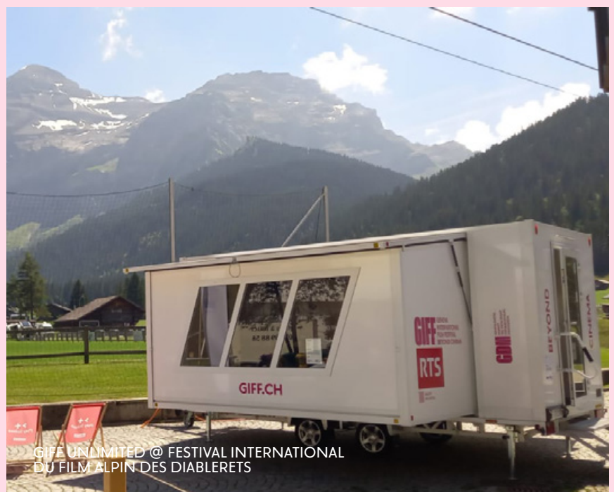
GIFF UNLIMITED @ FESTIVAL INTERNATIONAL DU FILM ALPIN DES DIABLERETS