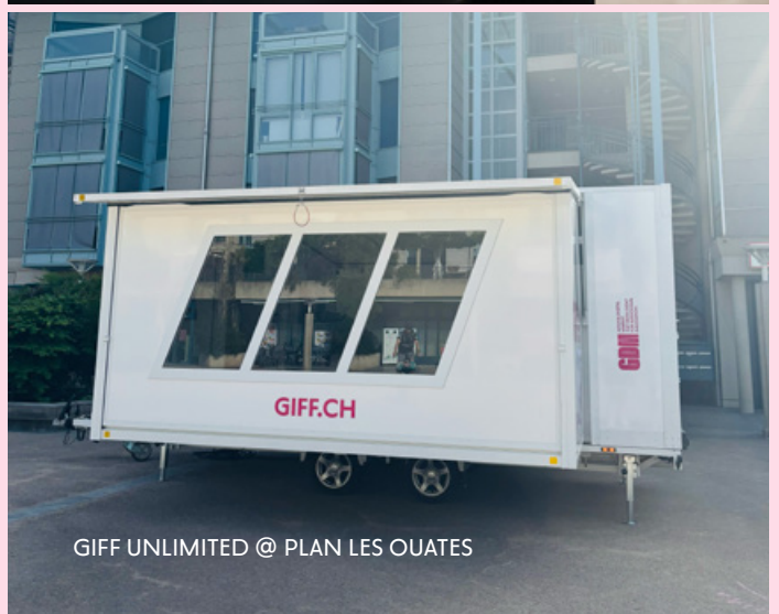
GIFF UNLIMITED @ PLAN LES OUATES