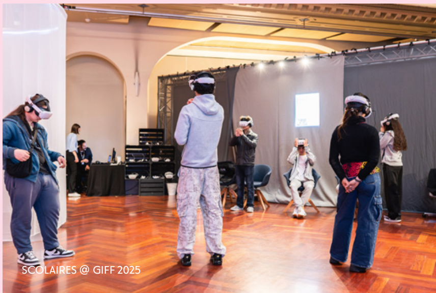
SCOLAIRES @ GIFF 2025