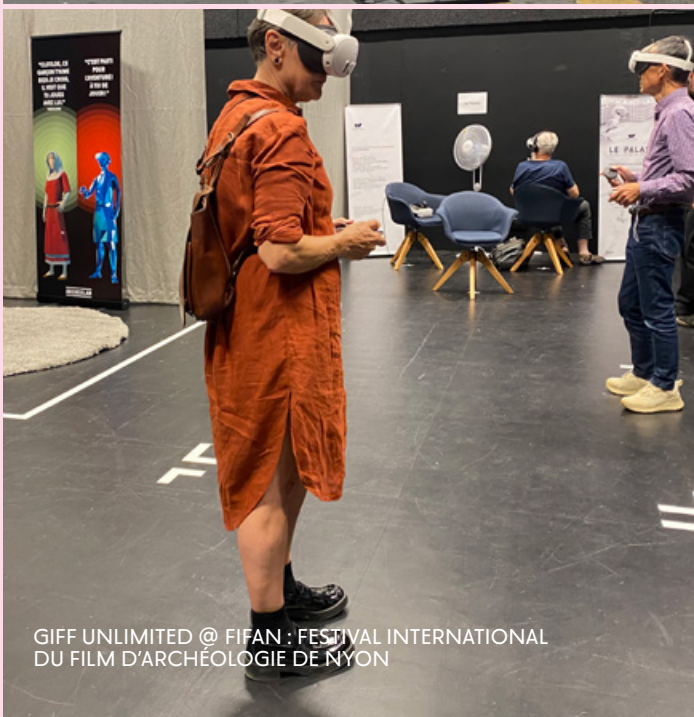
GIFF UNLIMITED @ FIFAN : FESTIVAL INTERNATIONAL DU FILM D'ARCHÉOLOGIE DE NYON