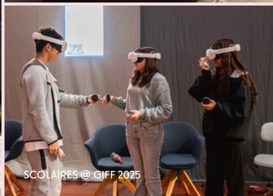
SCOLAIRES @ GIFF 2025