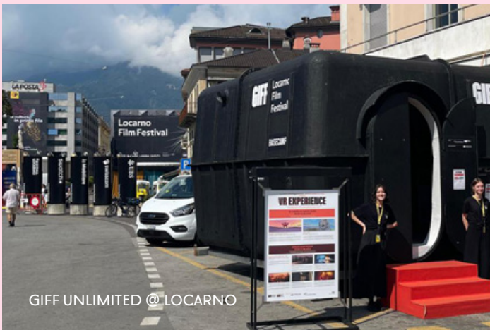
GIFF UNLIMITED @ LOCARNO

Lancé en 2021, le programme GIFF UNLIMITED regroupe les événements extra muros et toutes les collaborations entre le Festival et des écoles, des événements ou des institutions culturelles, en Suisse et à l'étranger. À ces occasions, le GIFF conçoit des programmes immersifs sur mesure pour ses partenaires. Il promeut ainsi l'avant-garde de la création numérique au-delà du cadre temporel et spatial du Festival, notamment en milieu scolaire.