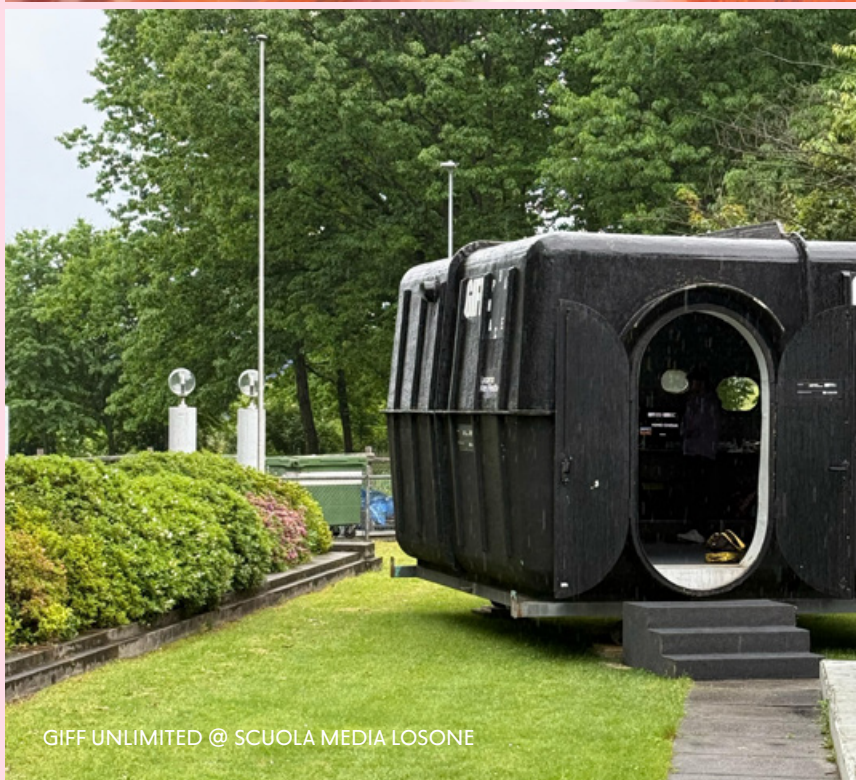
GIFF UNLIMITED @ SCUOLA MEDIA LOSONE