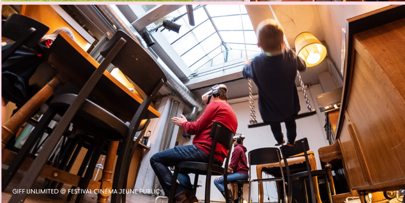
GIFF UNLIMITED @ FESTIVAL CINÉMA JEUNE PUBLIC