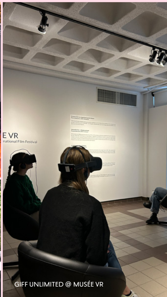
E VR national Film Festival